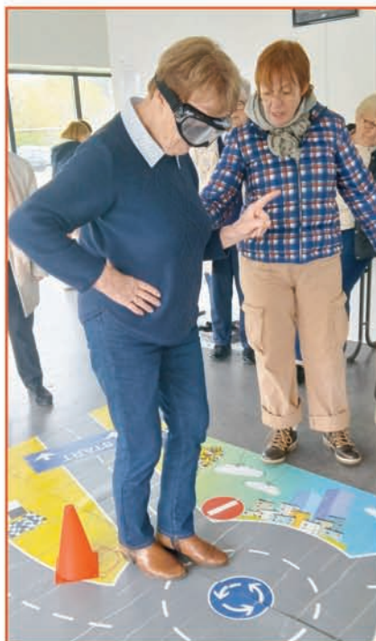
Evaluer les distances, contourner les obstacles, le parcours semé d'embûches