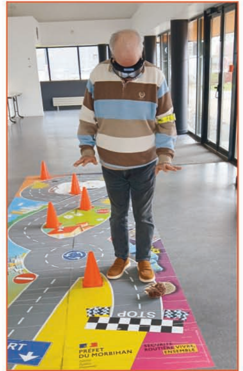
Claude ne se sent pas en sécurité, normal !!