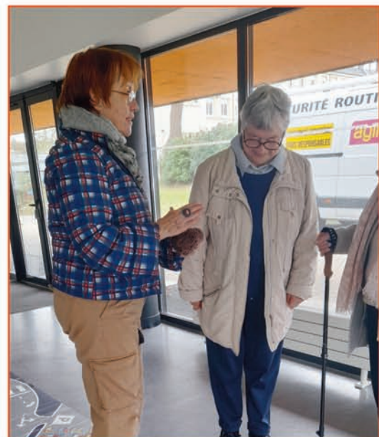
Quelques conseils avant le parcours